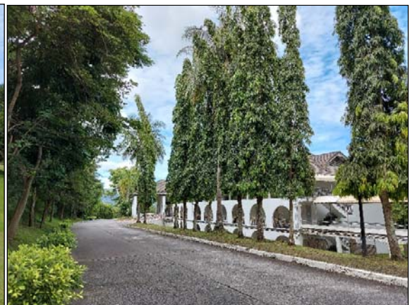
รูปที่ 1.1(2) จัดให้มีพื้นที่สีเขียว มีการปลูก ต้นไม้และหญ้าคลุมดินในบริเวณพื้นที่ว่าง