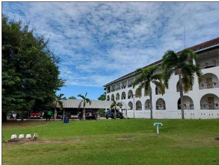
รูปที่ 3. 4(3) ทศนิยมภาพและสุนทรียภาพ อาคารของ โครงการฯ ได้มีการออกแบบตาม สภาพภูมิประเทศ