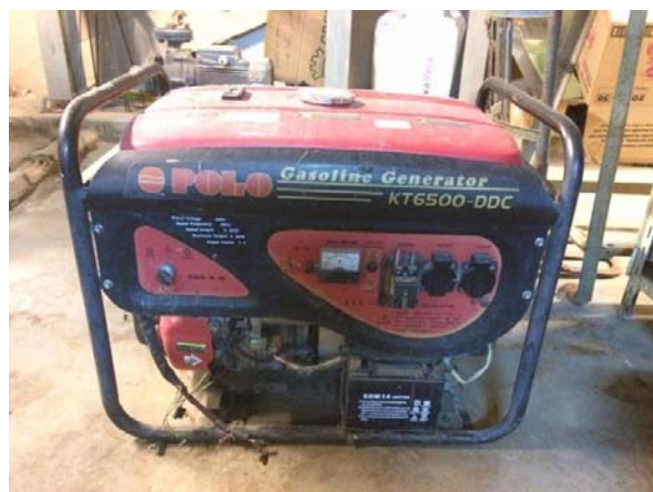
รูปที่ 3.2(5) เครื่องปั่นไฟขนาด 5KW