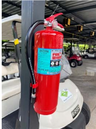
รูปที่ 3.2(2) จัดให้มีถังดับเพลิงชนิดมือถือ ชนิด Dry Chemical ขนาด 10 ปอนด์