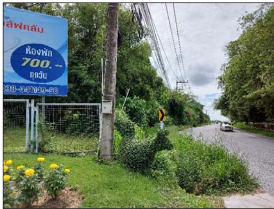
รูปที่ 1.1(1) จัดทำรั้วโดยรอบพื้นที่โครงการ