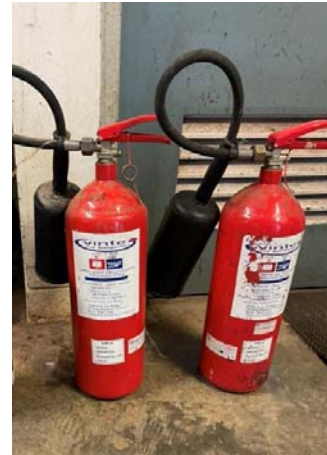
รูปที่ 3.2(3) จัดให้มีถังดับเพลิงชนิดมือถือ ชนิด Carbondioxide