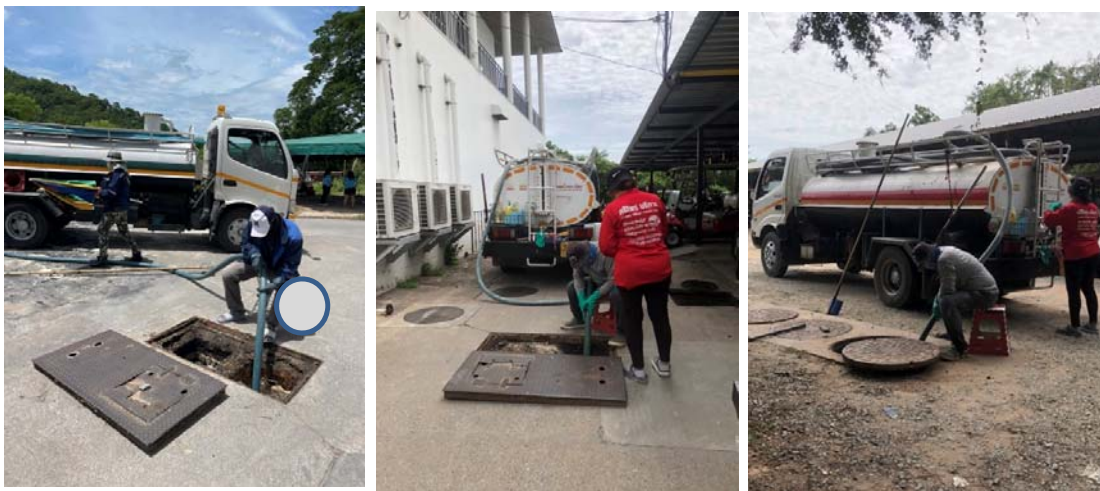
รูปที่ 1.6 การสูบล้างตะกอนออกจากระบบบำบัดไปกำจัด