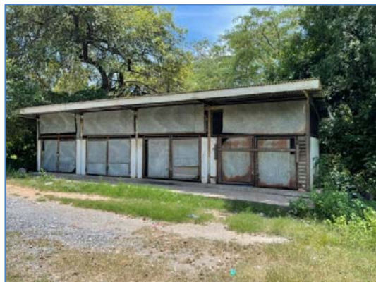
รูปที่ 2.3(1) จัดให้มีโรงพักขยะแยกประเภท

รวมขยะภายในมีถังขยะปิดมิดชิด ขนาด 240 ลิตร ตั้งไว้ภายในเพื่อป้องกันการรั่วไหล