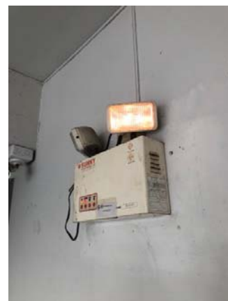
รูปที่ 3.2(6) ตรวจสอบชุดไฟฉุกเฉิน