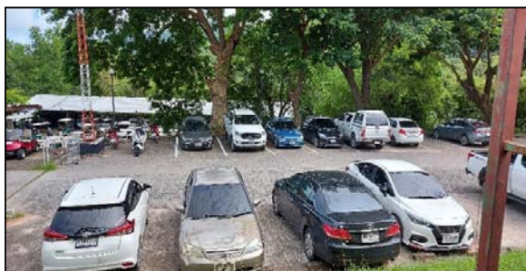
รูปที่ 2.5(1) ลานจอดรถ บริเวณหน้าอาคาร คลับเฮ้าส์