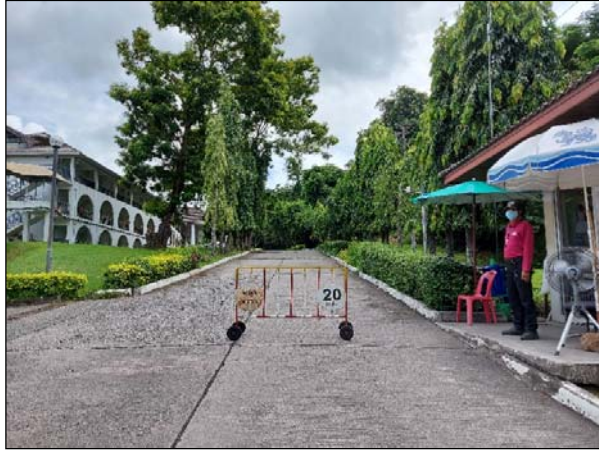
รูปที่ 3.1(1) เจ้าหน้าที่รักษาความปลอดภัย ดูแลทางเข้า-ออก ด้านหน้าโครงการ