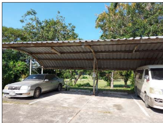
รูปที่ 2.5(2) ลานจอดรถ บริเวณ หน้าอาคารโรงแรมส่วนขยาย