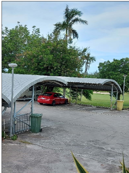
รูปที่ 3.3(2) จัดให้มีภาชนะรองรับขยะ ที่มีฝาปิด มิดชิด ตามจุดต่างๆ ของโครงการ