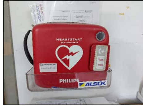
รูปที่ 3.3(1) มีเครื่องมือ/อุปกรณ์ใช้ในการ ปฐมพยาบาลเบื้องต้น