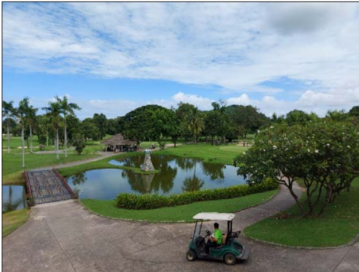
รูปที่ 3.4(2) ทศนิยมภาพและสุนทรียภาพ การจัด และตกแต่งพื้นที่สีเขียว