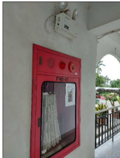
รูปที่ 3.2(4) ตู้สายฉีดน้ำดับเพลิง (Fire Hose Cabinet) ติดตั้งไว้ในอาคาร