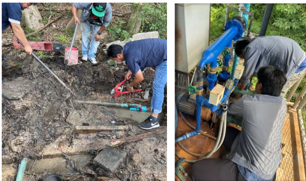
รูปที่ 2.1 ตรวจสอบรอยแตก/ชำรุดของระบบจ่ายน้ำ และระบบเส้นท่อประปาให้อยู่ในสภาพดีอยู่เสมอ