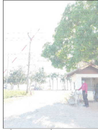
รูปที่ 3.1(2) เจ้าหน้าที่รักษาความปลอดภัย ดูแลทางเข้า-ออก หลังโครงการ (บริเวณบ้านพักคนงาน)