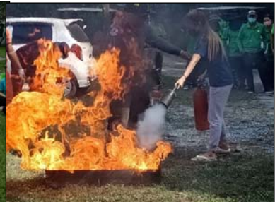
รูปที่ 3.2(1) จัดให้มีการอบรม และฝึกซ้อมการดับเพลิง และอพยพหนีไฟ